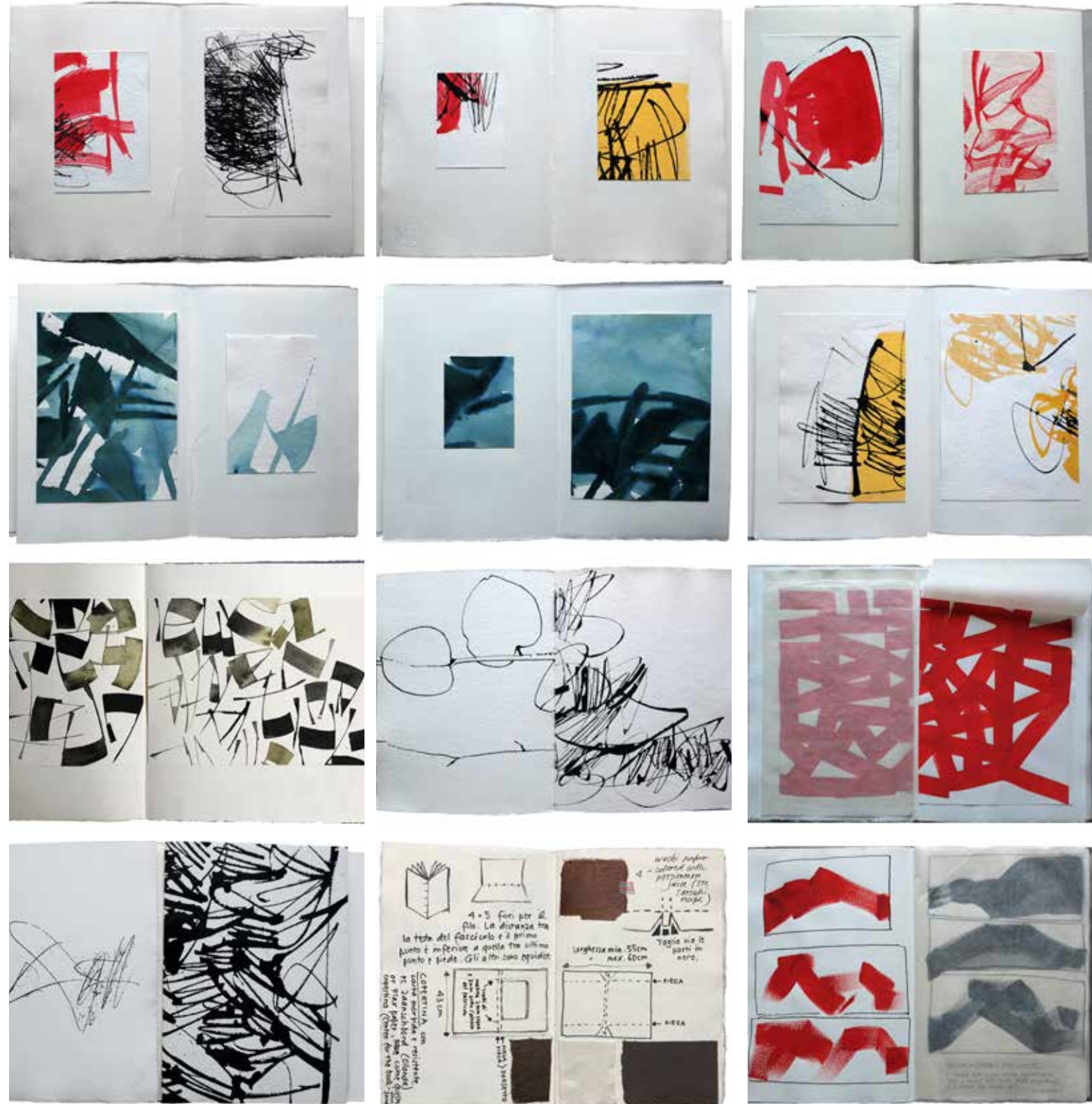
Tutte le immagini in questa pagina sono sketchbook di Monica Dengo

con Monica Dengo - 23-24-25 aprile 2021 - Venezia - Palazzo Minotto